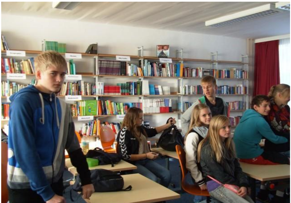
Unterricht in der neuen Bibliothek