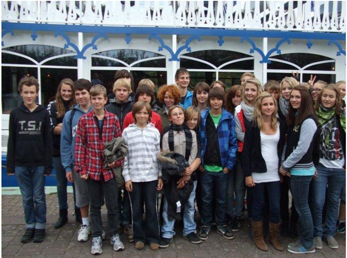
Ein erstes Kennenlernen erfolgte auf dem Motorschiff RIVERSTAR. Der Kapitän informierte uns über Geschichte und Natur der Umgebung. Trotzdem blieb genug Zeit für Gespräche.